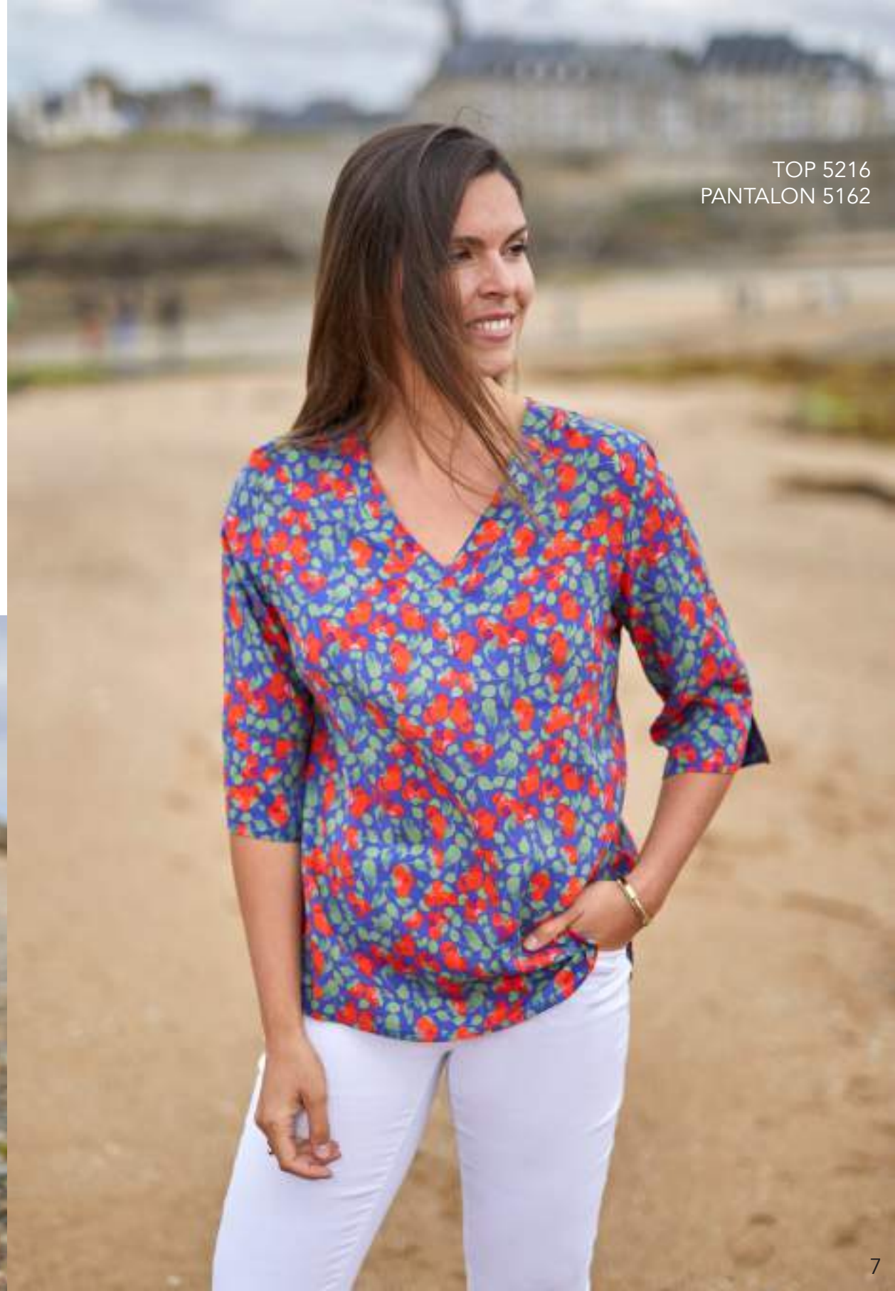
TOP 5216 PANTALON 5162