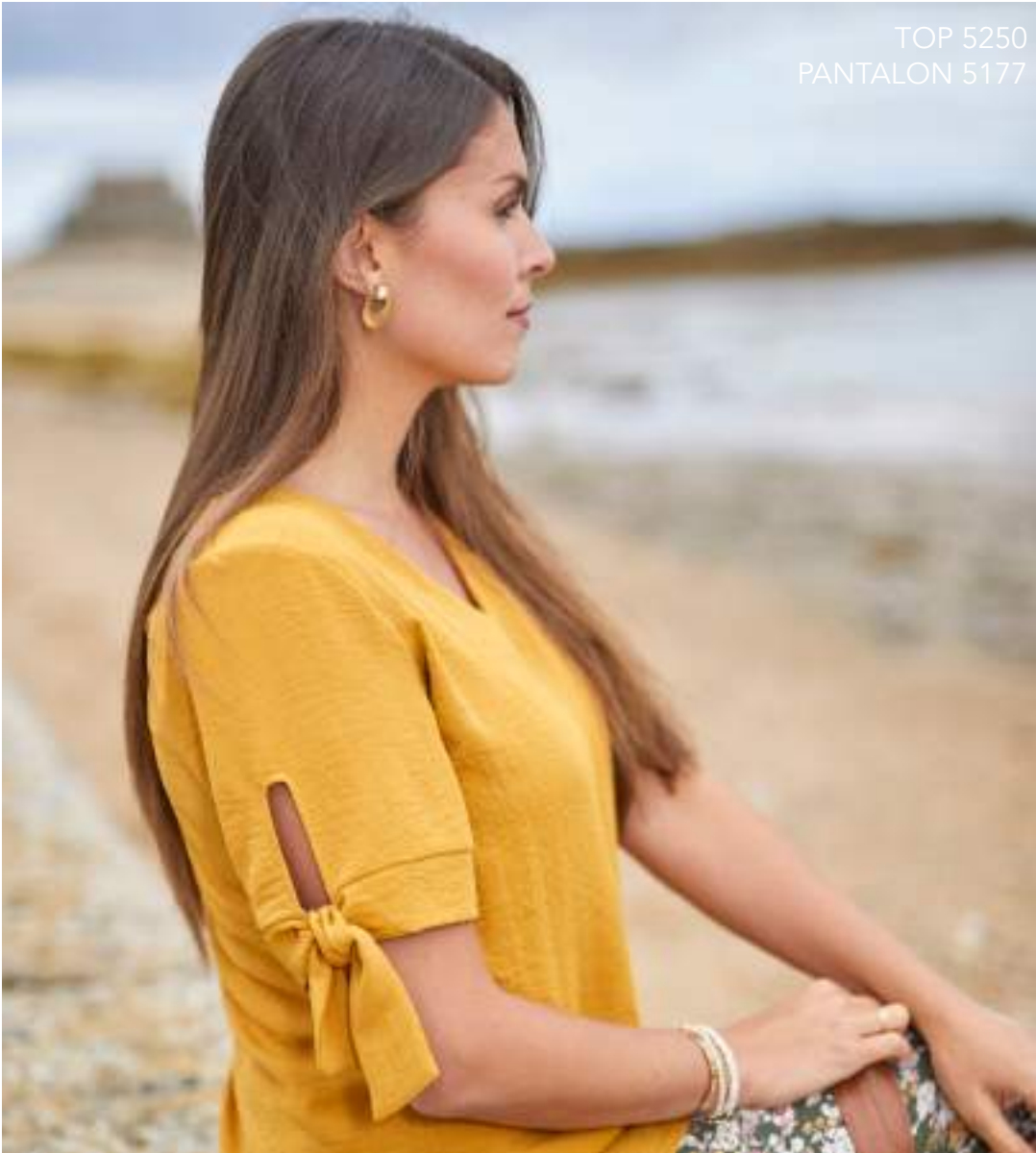
TOP 5250 PANTALON 5177